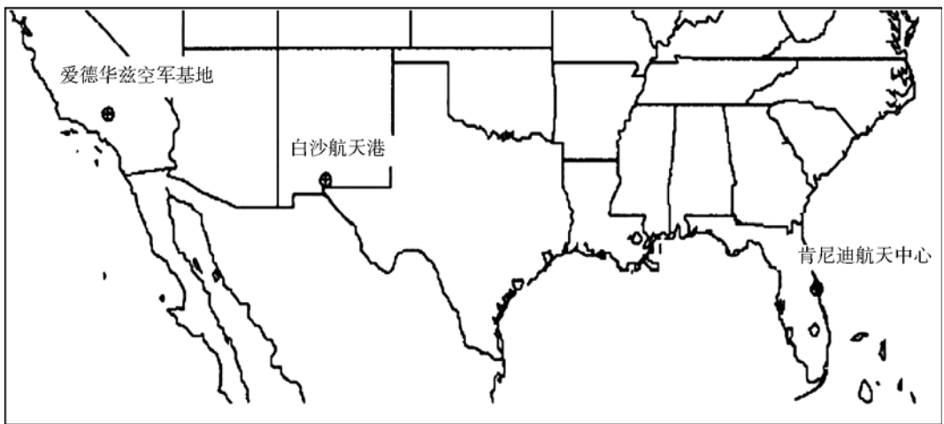
(a)美国本土主着陆场及应急返回着陆场

(4)第一天主着陆场返回模式(1st day PLS),为应急返回模式,当航天飞机出现重大故障时,由飞行主任指挥实施,该模式出现在飞行第 3~7 圈,或者发射后 3~10h 内,取决于飞行轨道倾角和可用的着陆机会,着陆场有肯尼迪航天中心、爱德华兹空军基地或白沙航天港。